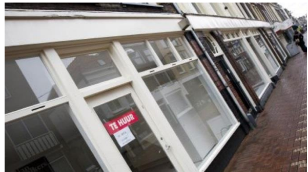
Zeeland: een vitale economische regio of een leeggelopen gebied?

Onze inzet is om de economie in Zeeland te versterken. Daarom vragen we: