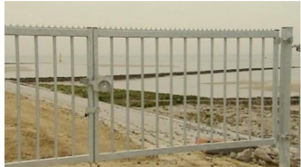
Zeeland: een fijn gebied om te werken, leven en recreëren of een natuureservaat met hekken er omheen?

Zeeland moet een gebied zijn waarin je fijn kan leven en recreëren. Concreet: