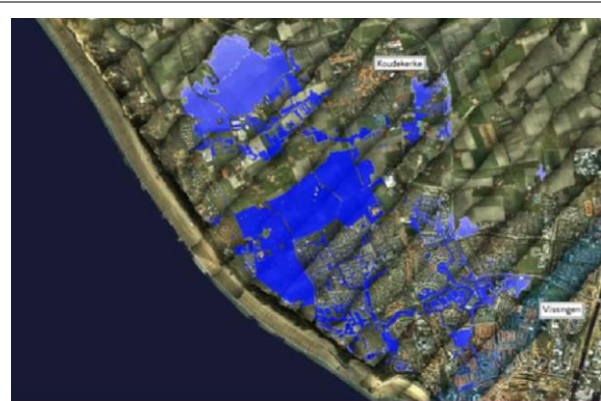
Zeeland: goed beschermt en economisch aantrekkelijk of vergeten gebied met grote kwetsbaarheid?

Onze inzet is om de waterveiligheid van Zeeland te blijven waarborgen. En concreet: