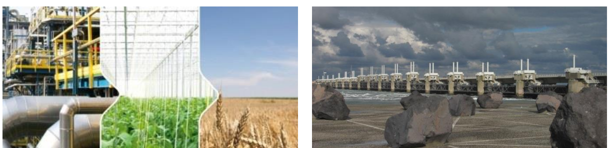
Zeeland: proeftuin voor technische innovatie of teren op de innovatiegolf van de jaren '70?

Wij staan dan voor de keuze: blijft Zeeland een proeftuin voor technische innovatie of blijven we teren op de innovatiegolf van de jaren '70?